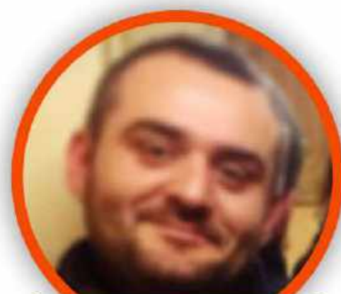
ROBERTO ZOLLO SCUOLA PRIMARIA